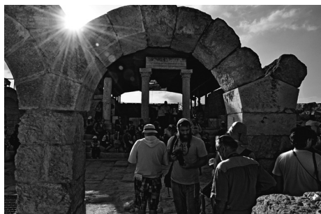
Сусия. Древняя синагога

Раскопки выявили хорошо сохранившиеся стены жилых домов и улицы, многочисленные подземные помещения, водосборники и бассейны для омовений,